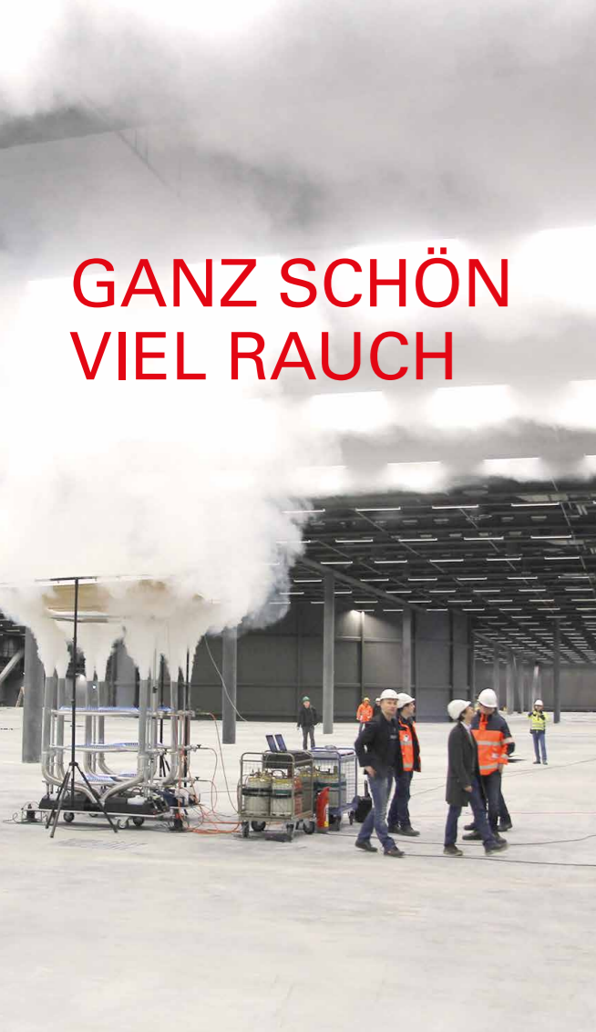
Messe Basel – Maschinelle Entrauchung in den Ausstellungshallen (ca. 38.000 m 2 ) und Foyers