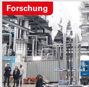
FEL Forschungsanlage, Hamburg