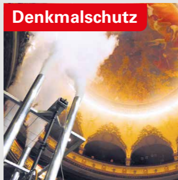
Historisches Theater Bern