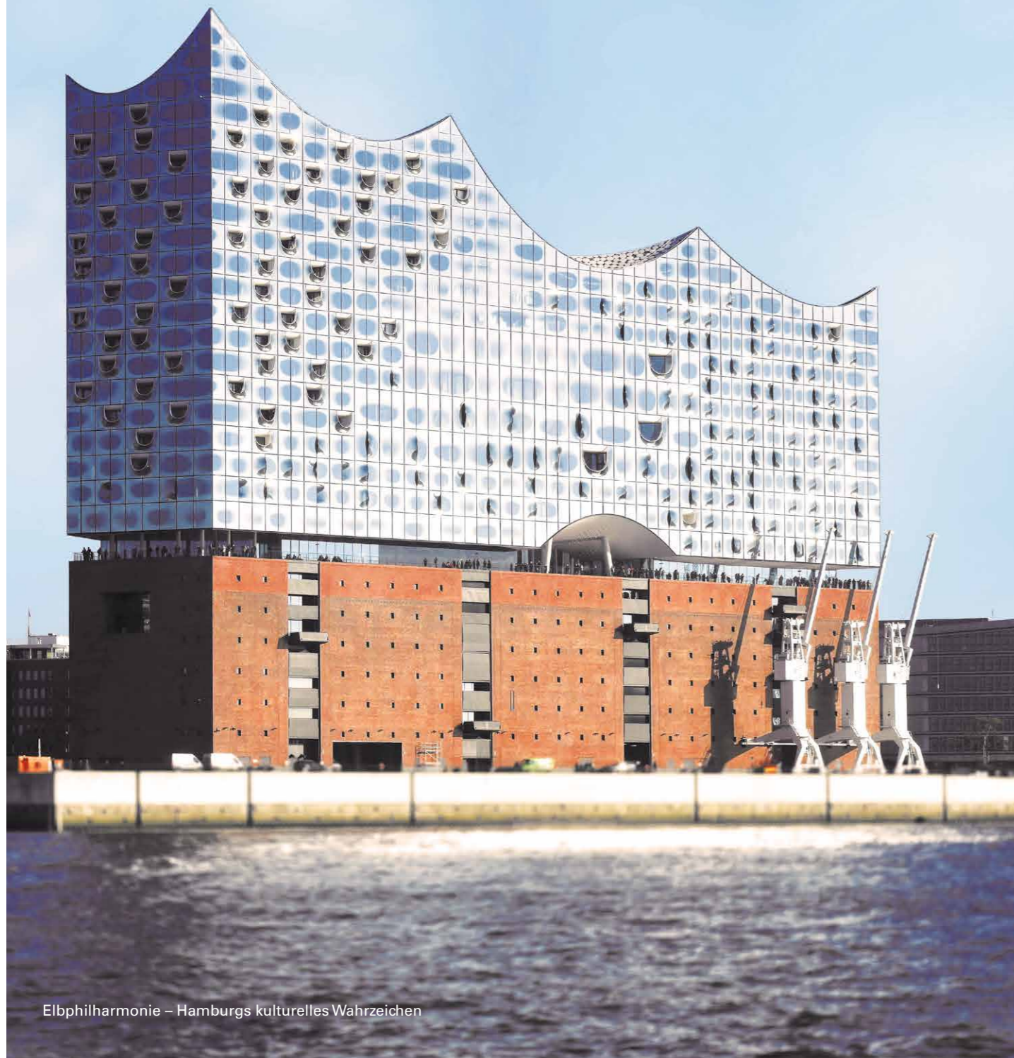
Elbphilharmonie – Hamburgs kulturelles Wahrzeichen

Der vorliegende Beitrag beschäftigt sich sowohl mit den Vorbereitungsmaßnahmen als auch mit der Durchführung und den Ergebnissen der im Grossen Saal der Elbphilharmonie durchgeführten Warmrauchversuche.