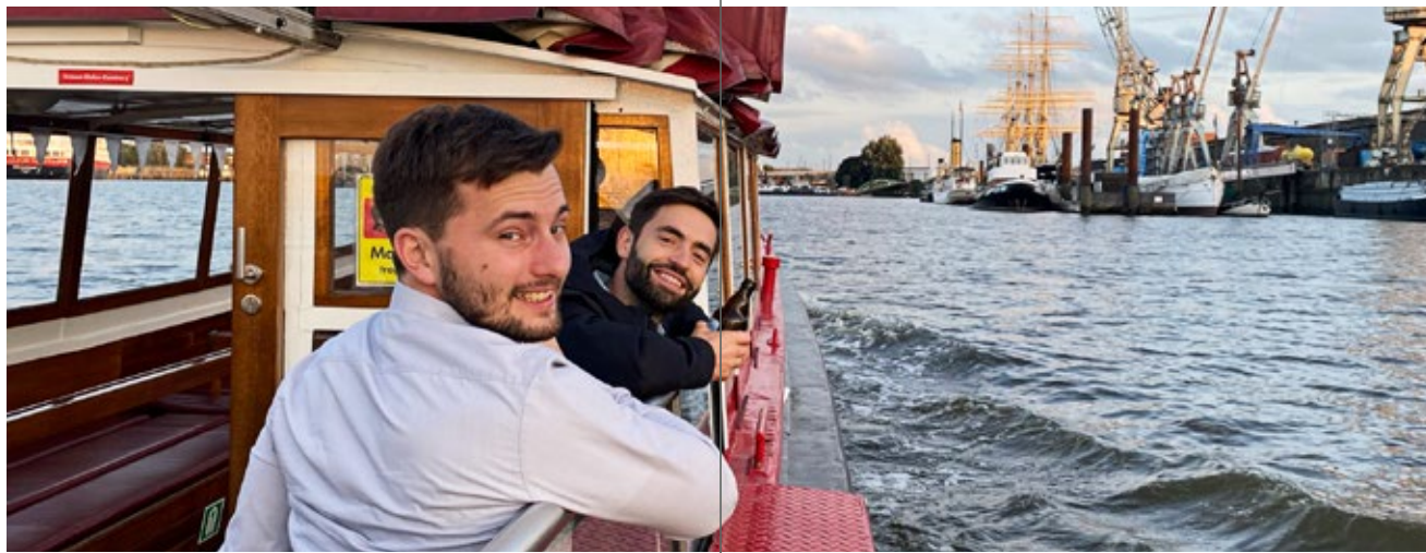
Un environnement de travail agréable et des relations collégiales sont au centre de nos préoccupations.

56% petits projets 41% moyens projets 3% grands projets