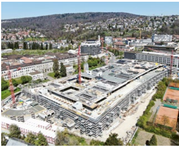
Le nouvel hôpital pédiatrique de Zurich a été conçu par Herzog & de Meuron – nos spécialistes veillent à sa réalisation.