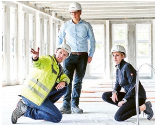
Réalise des projets en équipe et développe de nouvelles solutions innovantes pour les constructions de demain.